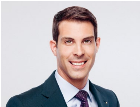
Thierry Burkart, Vizepräsident, Vorsitzender des Politischen Ausschusses und Präsident der Sektion Aargau

«Bevor neue Steuern und Abgaben für den Strassenverkehr erhoben werden, bedarf es eines Strasseninfrastrukturfonds und einer gerechteren Verteilung der bereits vorhandenen Gelder.»